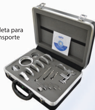
Maleta para transporte