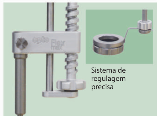
Sistema de regulagem precisa