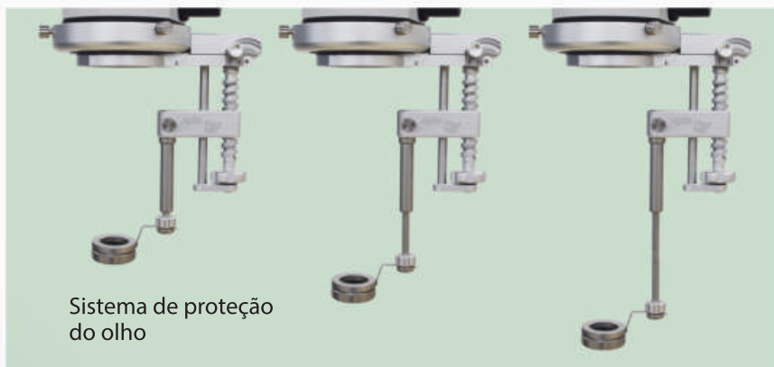
Sistema de proteção do olho