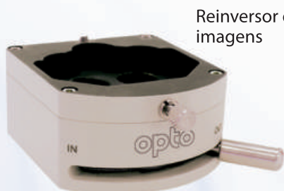
Reinversor de imagens