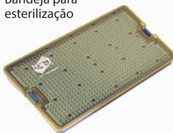
Bandeja para esterilização